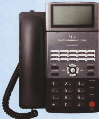
15鍵 大銀幕話機 (黑)