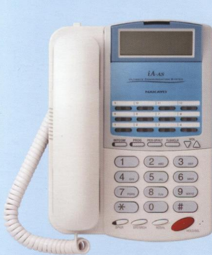
12鍵 銀幕話機 (白)

◆根據CIAJ(Communications and Information Network Association of Japan。日本通訊情報網路協會)提供之數據統計之結果。